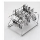
A068 印象トレー用ラック