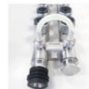
A141 ダクトコネクター