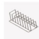
A063 トレイ / カセット立て