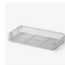
A082 バスケット 1/2