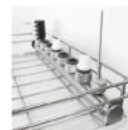
A086 内腔洗浄用ダクト