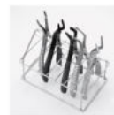
A071 プライヤー用ラック