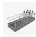
A064 縦収納用バスケット